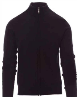
Črna / Crna