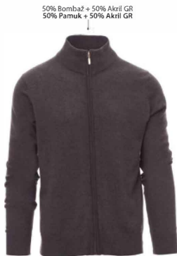
Pepelnato siva melanž / Melanž pekeljasto siva