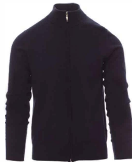
Momarsko modra / Momarsko plava